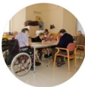
CENTRE DE DIA